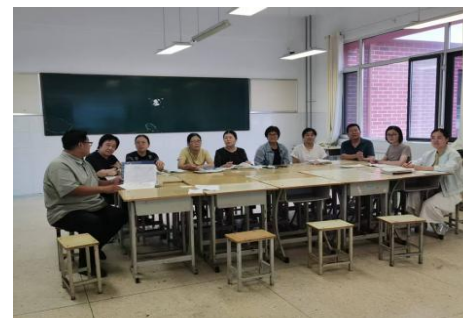
市教研室全体高中教研员一同参加了此次集体教研活动。（刘进君）

9月8日-9月11日，按照枣庄市教育科学研究院的通知要求，全市开始了普通高中学科集体教研活动。为促进全市教研工作提质增效，从新学期开始，统一全市普通高中学科半日集体教研安排。按照市教科院问题导向的原则，每月确定一个活动主题，常态化组织开展全市性的现场(或线上)项目式教研。我市高中各学校备课组基于主题，做好了具体活动设计，明确了每次活动的目标、内容和组织形式，开展了深度教研，全体教师认真领会专家指导精神，以“核心素养”为锚点，深入研读课标，精准把握教学重心，全面提高教学质量。同时各普通高中进一步加强集体教研管理，落实干部承包学科备课组制度，统筹兼顾，切实提高了校本教研活动质效，